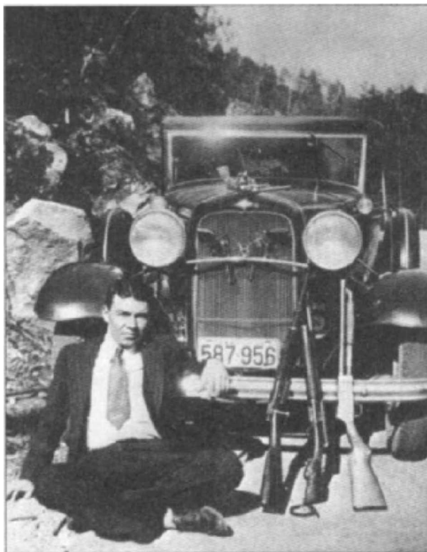
V.D. ir gaujos ginklai.