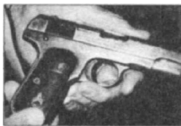
Klaido 32-ojo kalibro revolveris

Kartagenos miestuke, Misūrio valstijoje, išplėšus parduotuvės kasą, jie pasiglemžė tik saują metalinių monetų. Pagaliau Klaidas nusprendė, kad taip sunkiai dirbti ir rizikuoti savo gyvybe už tokį menką atlygį – pernelyg didelė prabanga, todėl nusprendė „pažvejoti“ gilesniuose vandenyse ir apsistojo ties gana padoriu Osvego banku. Boni, persirengusi, kiek leidžia galimybės, prašmatniau, apsimetusi, kad ketina atidaryti sąskaitą, apsilankė nužiūrėtame objekte ir iššniukštinėjo viską, ką tik buvo įmanoma per trumpą vizitą. Ji nubraižė pakenčiamą schemą, tad Barou galėjo susidaryti visai neblogą „mūšio“ lauko vaizdą.