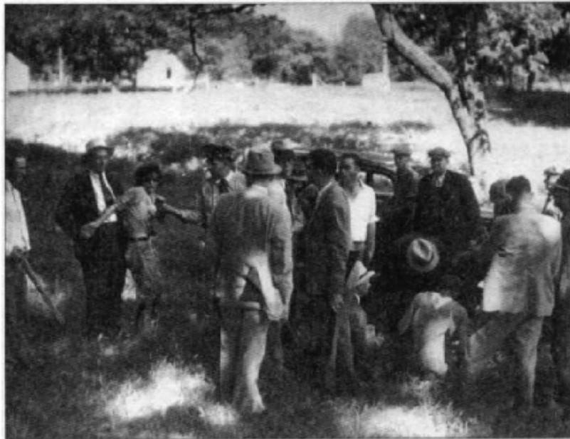
Deksfildo parke: kairėje – Blanša, laikoma dviejų pareigūnų. Dešinėje, prie gulinčio Bako, palinkę keli žmonės.

Pakilus saulei virš horizonto per sprindį, Boni pastebėjo medžiotojus, sėlinančius mišku. „Klaidai, jie vėl mus rado“, – beviltiškai pratarė ji. Arčiausiai stovėjo suvarpyta kulkų senoji mašina. Jie dar spėjo į ją sulipti. Klaidas pasuko į keliuką, bet už šimto jardų pamatė stovinčius ginkluotus žmones. Jis suprato, kad visi keliai ir takeliai jau užtvirti. Klaidas pasuko automobilį į miško gilumą, tačiau visur stovėjo šerifo žmonės ir be atvangos šaudė. Kulka pataikė Klaidui į ranką. Dėl netikėto skausmo jis akimirkai paleido vairą, ir mašina trenkėsi į medį. Nustebusi Boni žiūrėjo į šratų sudraskytą savo ranką, lyg negalėdama patikėti tuo, ką mato. V.D. konvulsiškai trūkčiojo, nes į jį pataikė kulka. Boni ir Klaidas išlipo iš mašinos ir nuskubėjo į tankmę. Bėgti prie naktį pavogtos mašinos nebuvo jokios prasmės, nes ji medžiotojų buvo sušaudyta taip nuoširdžiai, kad tiko tik metalo laužui. Blanšai taip pat pavyko palikti senąjį „fordą“ ir net ištraukti savo beveik mirusį vyrą. Dabar ji gulėjo šalia mašinos, savo kūnu pridengdama vargšą Baką, o virš jų švilpė šimtai kulkų. Klaidas paskutinį kartą pažvelgė į brolių ir, susilenkęs dvilinkai, nuskubėjo paskui Boni.