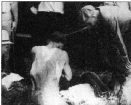
Bakas Deksfildo parke.