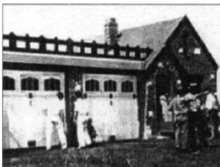
„Raudonosios karūnos“ motelis.