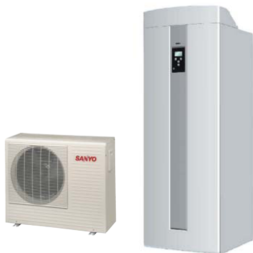
„SANYO CO 2 ECO oro šilumos siurblys ir vidinė vandens talpa su integruotais šildymo sistemos ir geriamo vandens pašildymo kontūrais“